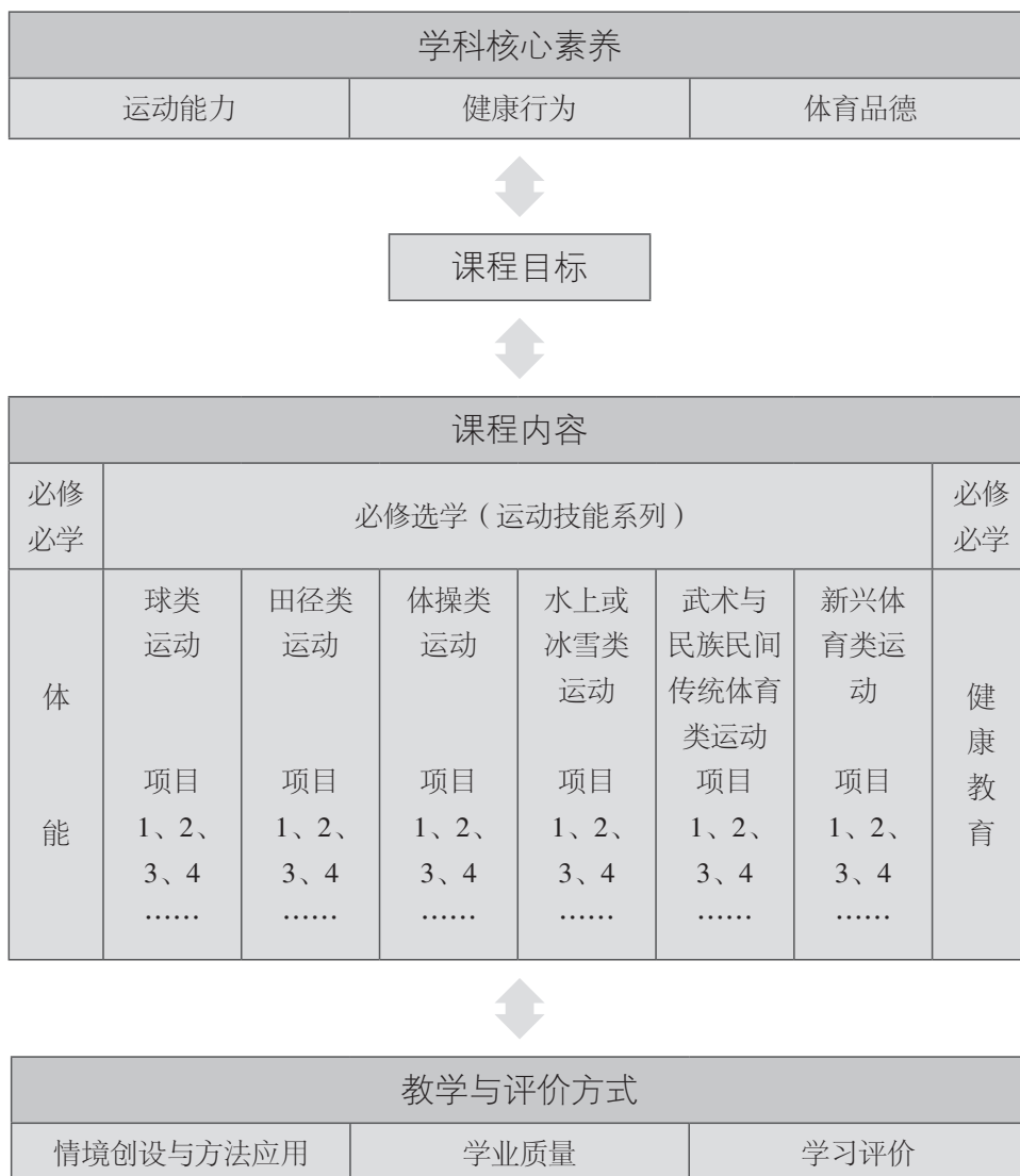
图1 普通高中体育与健康课程结构

及个性发展的需要，课程内容包括球类运动、田径类运动、体操类运动、水上或冰雪类运动、武术与民族民间传统体育类运动和新兴体育类运动6个运动技能系列。每个运动技能系列由若干运动项目组成，如足球、跳远、健身健美操、蛙泳、防身术、花样跳绳等，每个运动项目由包含相对完整内容的10个模块组成，以便学生对所选模块进行较为系统的学练。体能和健康教育包括内容要求、教学提示；运动技能系列中每个模块包括内容要求、教学提示和学业要求。